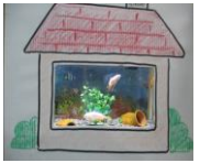
おうちを作ろう (くりぬきあそび)

【今月の工作】 こいのぼりプロジェクト 「こどもの日」はこいのぼりで いっしょにしよう! 【乳幼児向け工作】 10:00～11:30 おうちを作ろう(くりぬきあそび) かたつむり ぬりえ 【小学生向け工作】 14:30～16:30 おうちを作ろう(くりぬきあそび) 戻ってくる?プーメラン ぬりえ